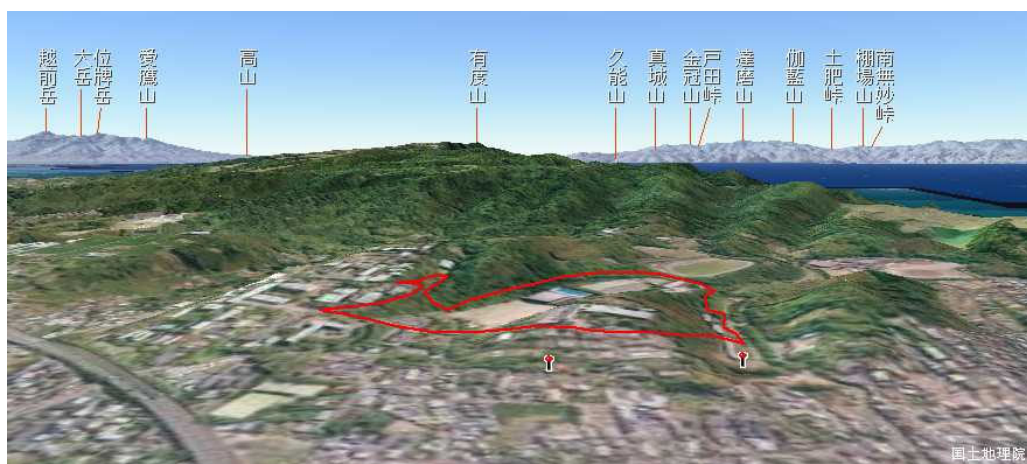
GPS データの 3 次元表示（大谷キャンパスでの実習ルート）

2. 当日、スマートフォンを持参でき、スマートフォンアプリをインストールできるよう、環境を整備している人。