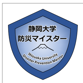
◀ 静岡大学防災マイスター オープンバッジ

特別教育プログラムの「防災マイスター」は、オープンバッジの発行対象となっています。