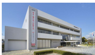
◀ 静岡県地震防災センター （静岡市葵区）

なお、都合により認定講習を受講できない場合は、次年度の同講習を受講することが可能です。