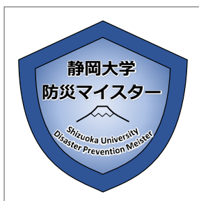
◀ 静岡大学防災マイスター オープンバッジ

特別教育プログラムの「防災マイスター」は、オープンバッジの発行対象となっています。