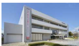
◀ 静岡県地震防災センター （静岡市葵区）

なお、都合により認定講習を受講できない場合は、次年度の同講習を受講することが可能です。